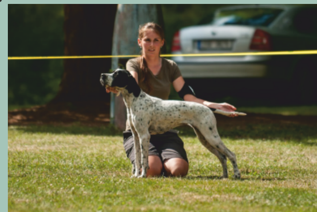
Pointer - Aira z Vlčích hor výborný1, CAJC, BOS, BOJ