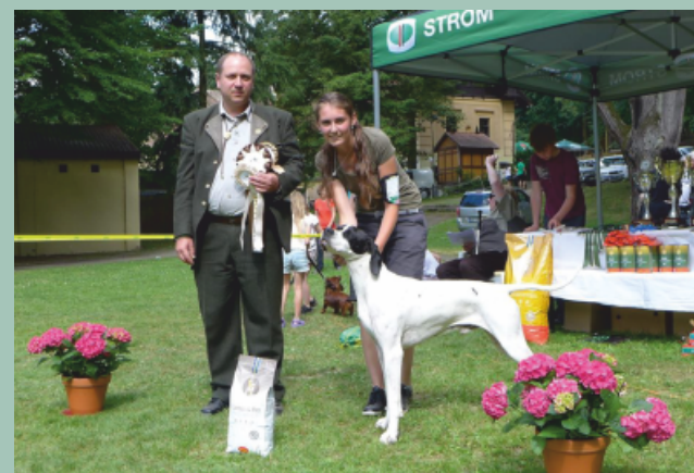
Pointer - Ben Bohemia Frony výborný1, CAC, KV, BOB