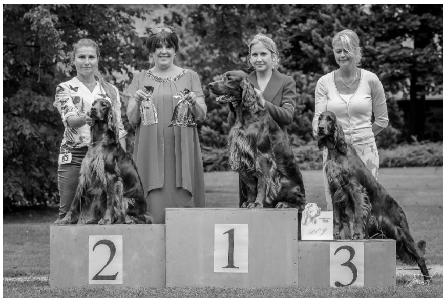
BOB, BOS, BOJ