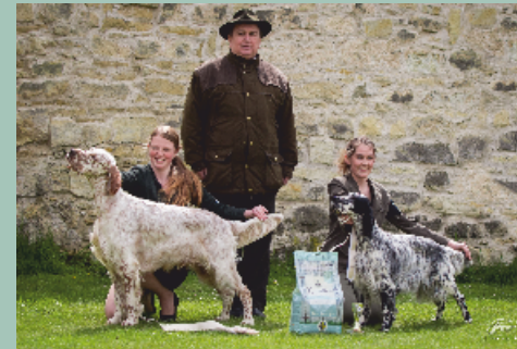
Anglický setr - Aslan like an Angel Royal Setter V1, CAJC, BOS, Nejkrásnější mladý Macarena II de los Vitorones V1, CAC, BOB