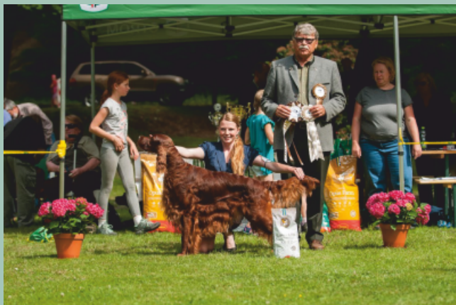
Irský setr - Earnest Enthusiast Everdene výborný1, CAC, KV, BOB, BIS