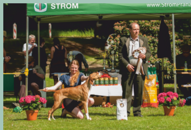
Pointer - Ceva z Mešinské hájovny výborný1, CAC, KV