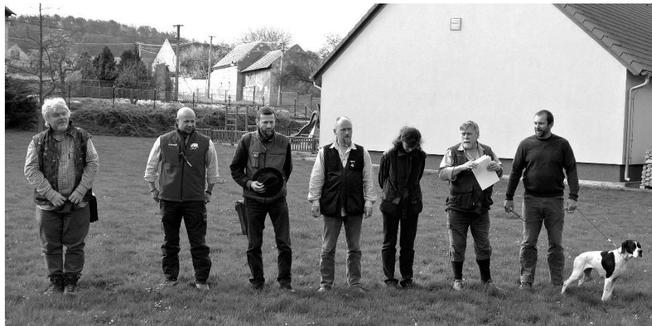
Rozhodčí MFT Kladno 14.-17.4.2017