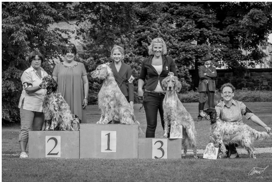
BOB, BOS, BOJ, BOV