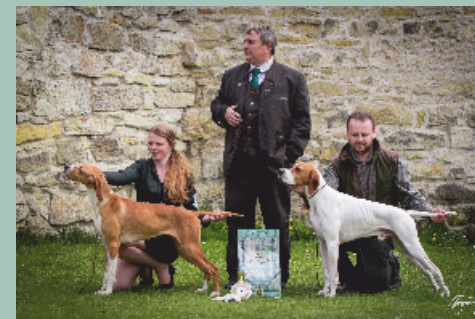
Pointer - Ceva z Mešinské hájovny V1, CAC, BOB, BIS Argo z Mešinské hájovny V1, CAC, BOS