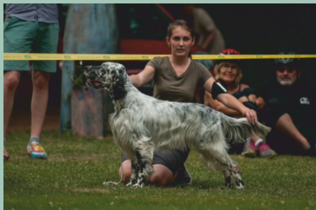
Anglický setr - Am z Vlčích hor výborný1, CAC, KV, BOS