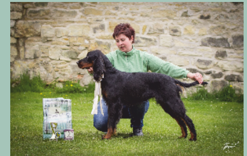
Gordon setr - Eliška z Wenytry V1, CAC, BOB