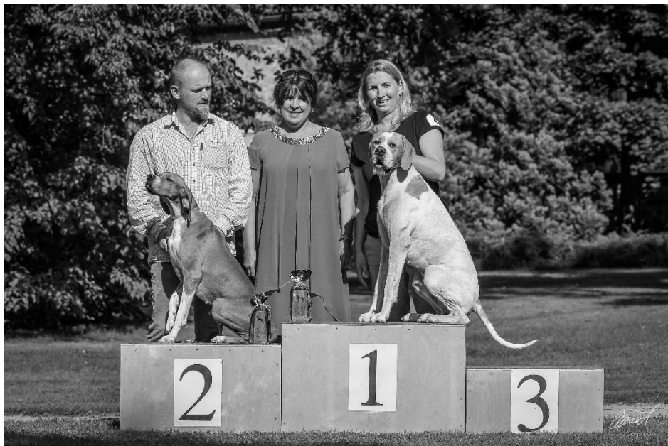
BOB a BOS