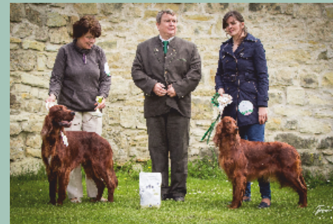
Irský setr - Fred od Rakovské tůně V1, CAC, BOB Abrakadabra Zannanza V1, CAC, BOS