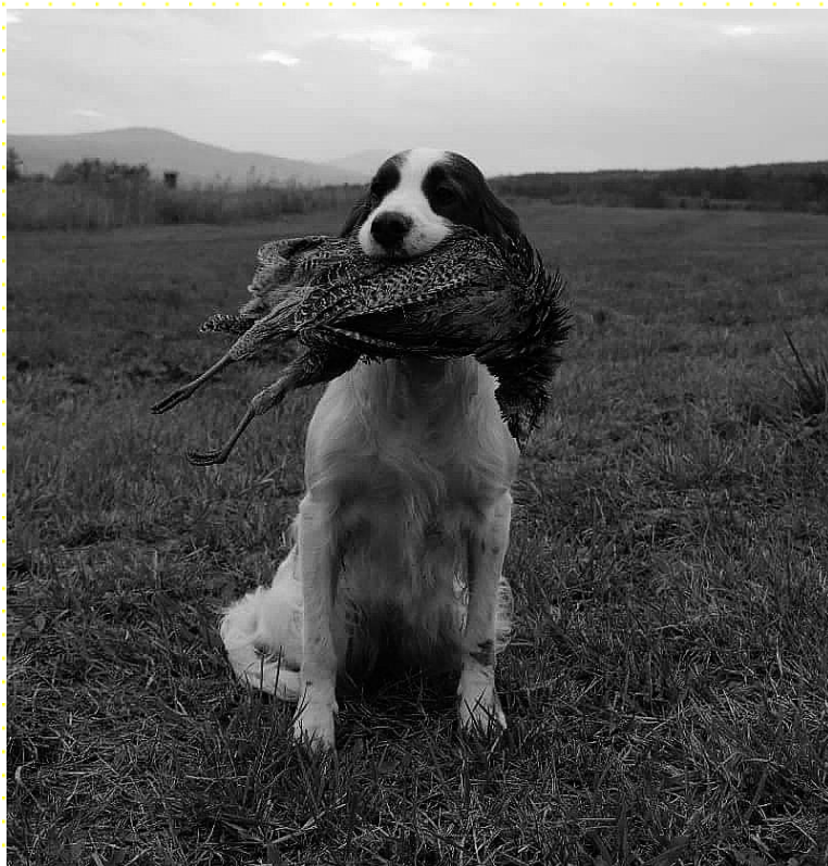
Biara Breeze Artegerd