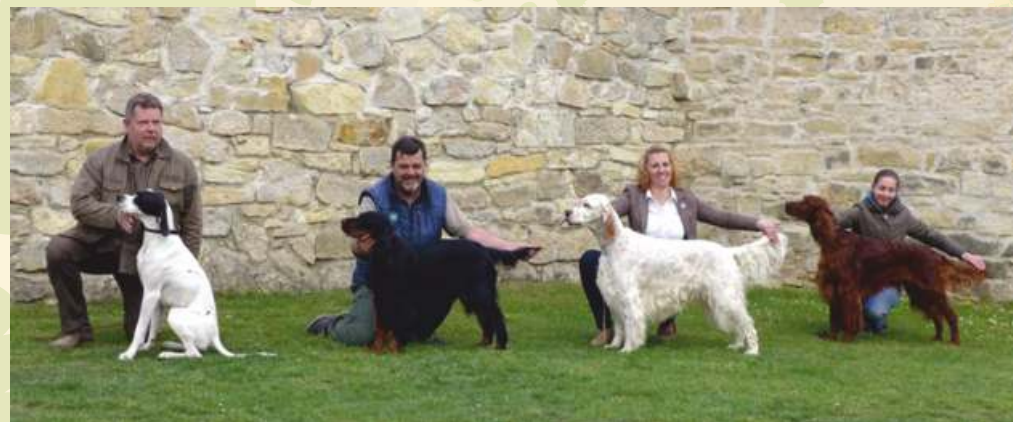
BOBové POI - Ben Bohemia Frony GS - Kaira z AS - King Magenta-In-Blue IS - Amore Mio Daisy Rain