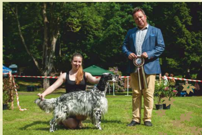
AS - Macarena II de Los Vitorones Klubový vítěz, BOB