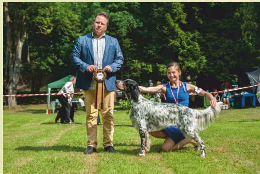
AS - Kameron z Mešinské hájovny Klubový vítěz, BOS