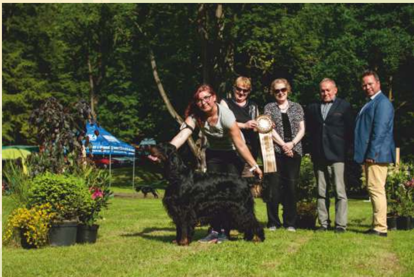
GS - Black Mystery Prince of Gordon Klubový vítěz, BOB, Nejlepší jedinec výstavy - BIS