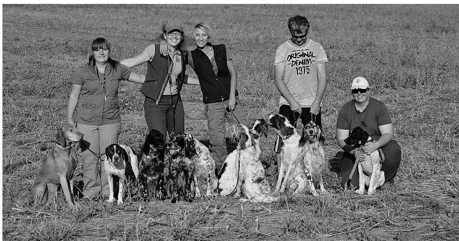
Letní FT na křepelky - Rakousko