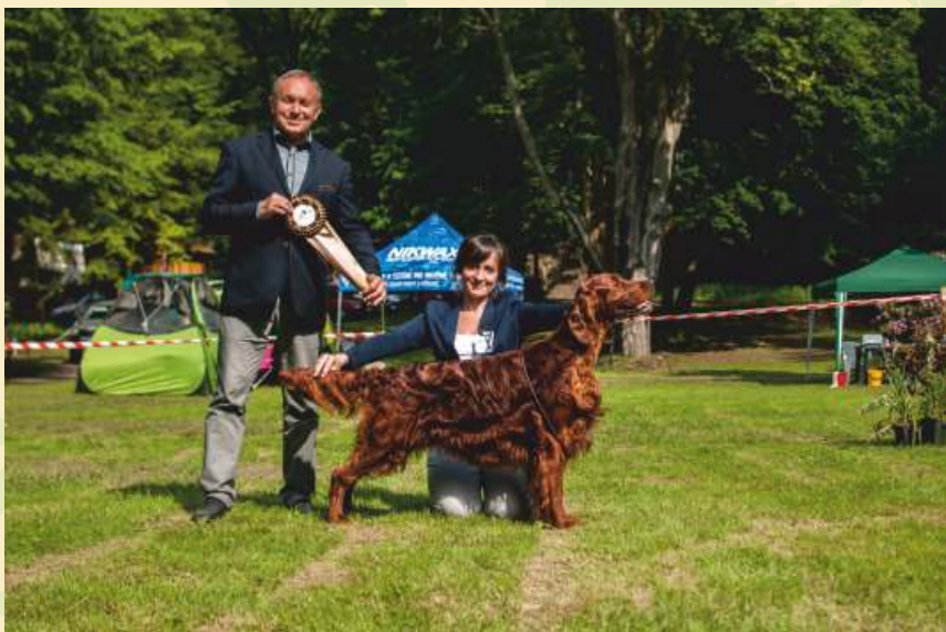
IS - Copper's Gypsy Rose Klubový vítěz, BOB