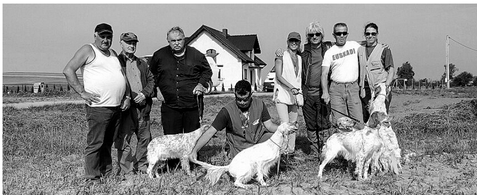
FT na koroptve – Polsko, Busko–Zdrój