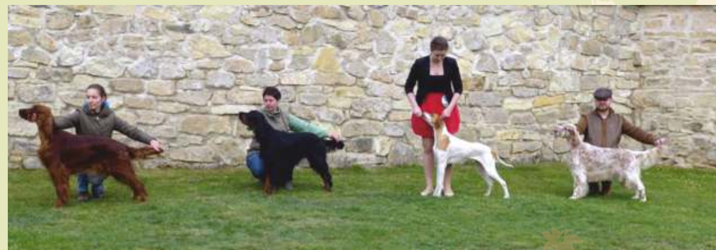
BOBové IS - Carmen Cristine Mahagony Paw GS - Darwin z Wenytry POI - Ara z Kunčiny Vsi AS - Snow On The Sahara Latin Lover