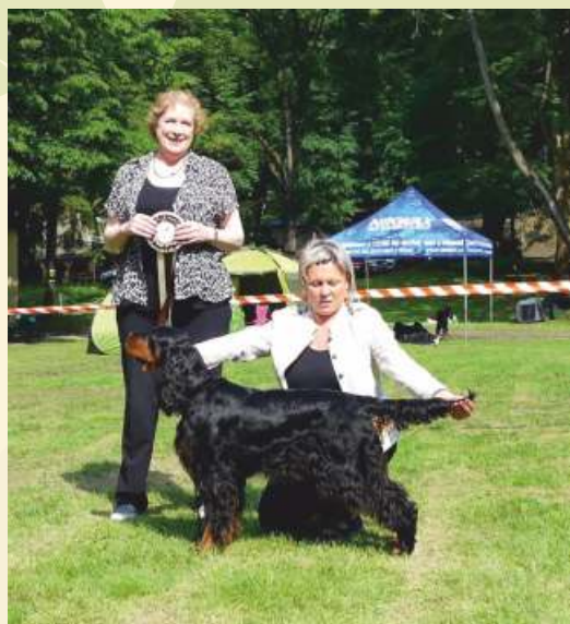
GS - Celtic Blackened Kochanej Emilki Klubový vítěz, BOS