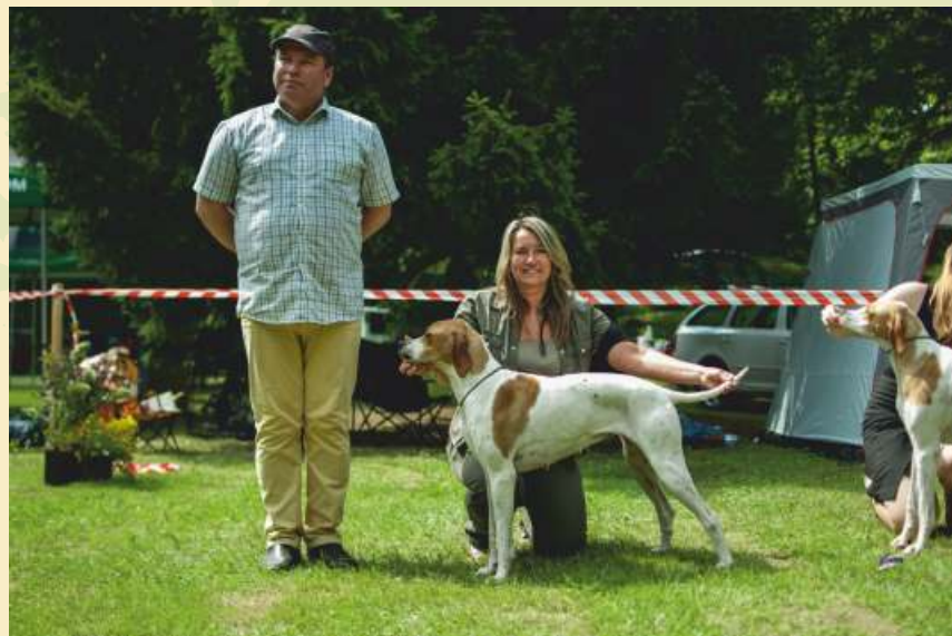
Xaira z Mešinské hájovny Klubový vítěz, BOS