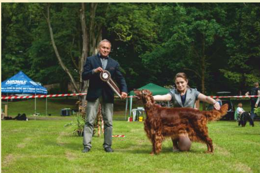
IS - Aenigma Quara Torvitas Klubový vítěz, BOS