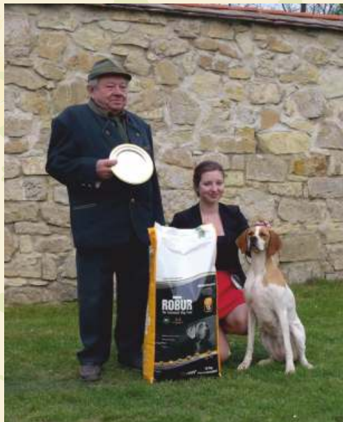
◀ BIS - POI - Ara z Kunčiny Vsi

▶ Nejlepší pár výstavy July Sunburst Lorien a Snow On The Sahara Latin Lover, tento pár byl i nejlepším párem v plemeni na Evropské výstavě