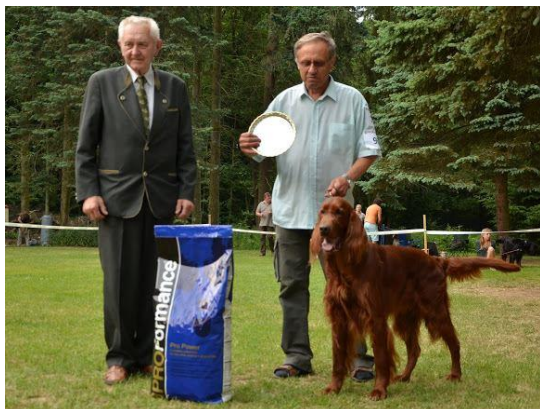
Monty od Rakovnické brány - Nejkrásnější pracovní pes Klubové výstavy