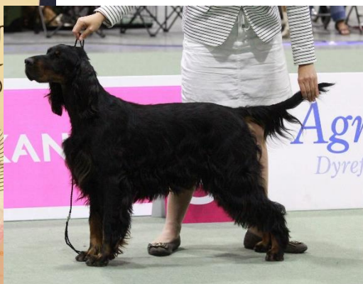
Xsara z Holubické stráně