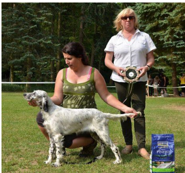
Meggi od Alpské protěže - Nejkrásnější štěně Klubové výstavy