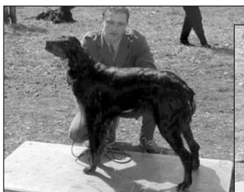
Cíta z Kobyliských hor