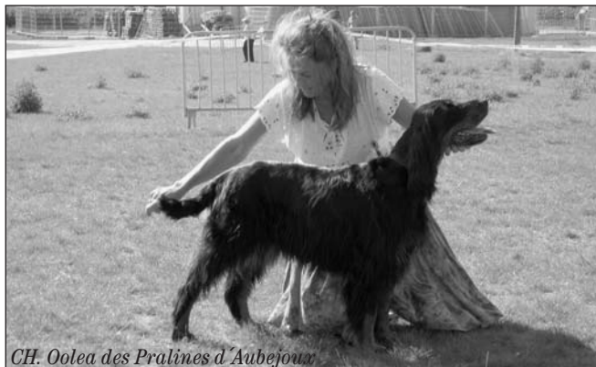
CH. Oolea des Pralines d'Aubejoux

Podrobné výsledky naleznete na www.settergordon.com .