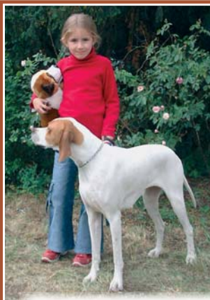
vítězka soutěže „Dítě a pes“