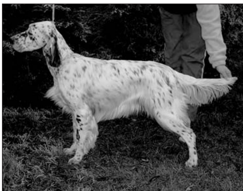
Bowie Leslie Leven

Závěrečné soutěže posuzovali všichni tři rozhodčí