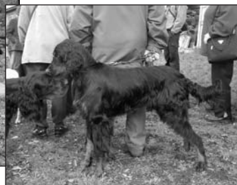
Tomy Czech Pamír