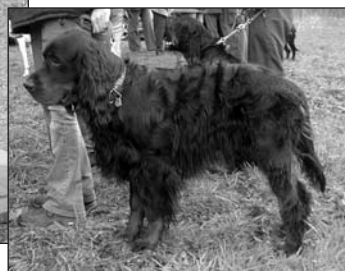
Chan z Bojandolí