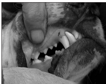
ZUBY – chyba