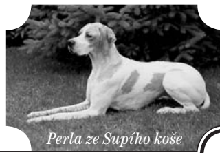
Perla ze Supího koše

Odchodem přítele Klíkara skončila jedna etapa chovu pointerů pod Broumovskými stěnami a Supím košem.