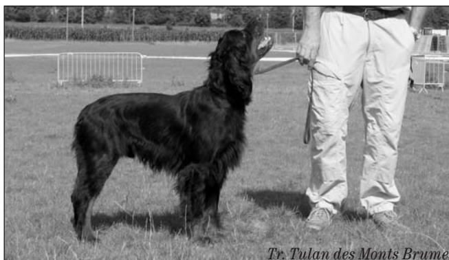
Tr. Tulan des Monts Brume

dý rozhodčí nezávisle na svých kolezích posoudil. Udělení titulů CACS a RCACS bylo ve všech třídách a do soutěže o nejlepšího psa výstavy nastupovali po posouzení všemi rozhodčími i první ze třídy mladých, šampionů a veteránů. Tyto třídy měly samostatný kruh a posuzoval je jiný rozhodčí. Pauza na připravený oběd na nově zrekonstruované Ferme Du Ru Chailly, na jejichž pozemcích se akce konala, byla asi hodinu a půl. Odpolední program byl podle stejného principu. Následovaly přehlídky chovatelských stanic a soutěže. Na výstavě se sešlo 5 generací chovatelské stanice des Quasars a představili se v kruhu samostatně. 13 Gordonů