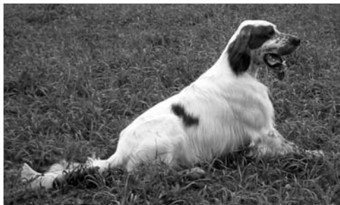
Anquilla Vis Tranquilla