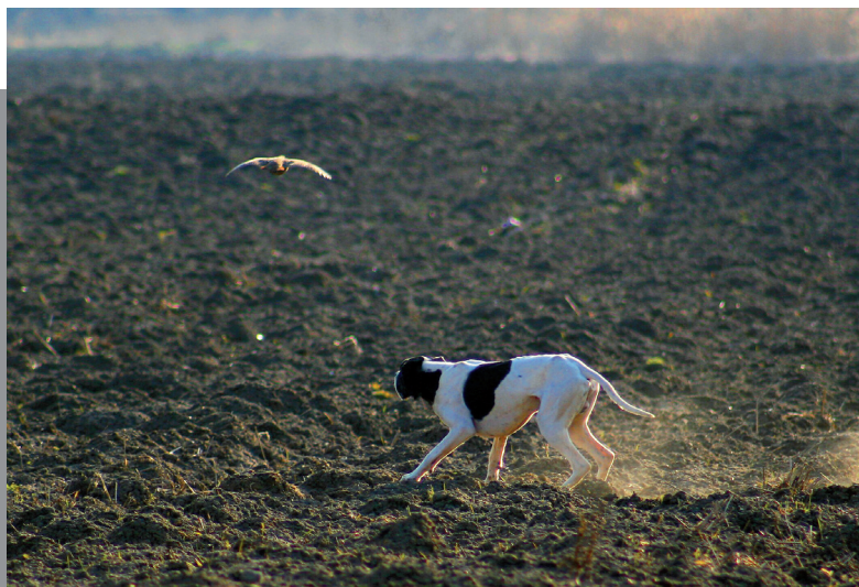
Charakteristickou vlastností pointera je pevné efektní vystavování.

Dostatečně široký a prostorný hrudník sahající k loktům lemují klenutá žebra. Břicho je ploché, slabina vtažená.