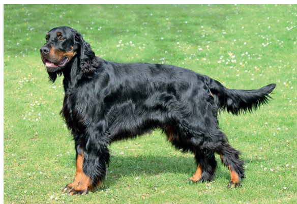
Gordonsetr se vyznačuje pevnou stavbou těla symetrických linií.

Srst na hlavě, předních stranách končetin a špičkách slech je krátká a jemná, na ostatních partiích těla je střední délky, bez kudrlin či zvlnění. Nejdelsí je na vrchní straně slech, zadní straně končetin, na hrudníku, břiše a prutu.