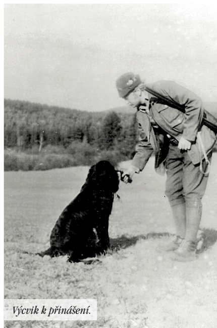
Výcvik k přinášení.

Hlasitost není pro gordony vysloveně typickou vlohou. Jsou jedinci, kteří mají volný hlas, ale neměl jsem jich mnoho. Stoprocentně hlasitý u zhaslého kusu byl jen můj první gordon. Nikdy nezapomenu na jeho dosledy srnců. Když byl večer nasazen na nástřel, někdy jen pomysl-ný, za několik minut se z lesa ozvalo spontánní hlášení. To pro mě byla rajská hudba. Znali ho i myslivci ze sousedních honiteb. Já ale hlásiče nebo oznamovače násilně necvičím. Na zkouškách vedu psy jako vodiče a teprve v praxi se ukáže, pro