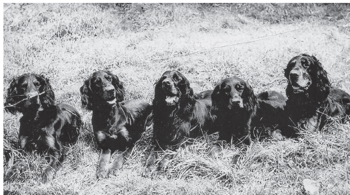
Skupina gordonsetrů v chovné stanici Green River (1973).

Gordon až s rozvojem linie ve Fochabers a také po rozprodeji tohoto renomovaného psince.