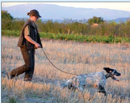
Vladimíra Dvořáková a Faust Vis Tranquilla